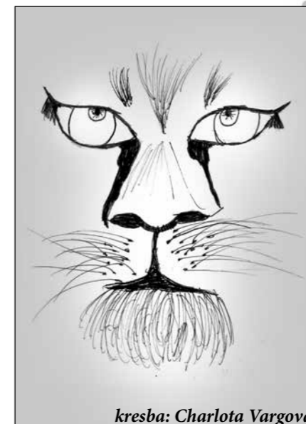
kresba: Charlota Vargová