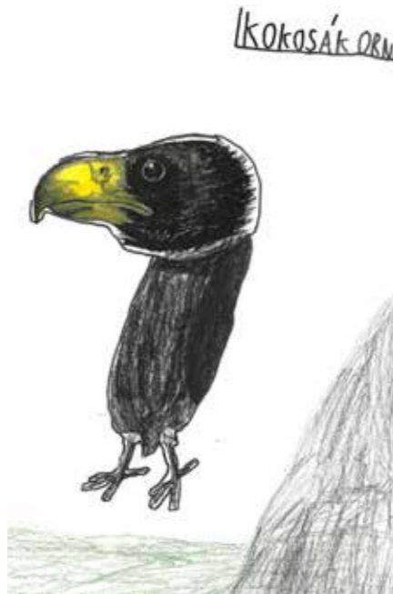
Zuzka Velková, 3. C