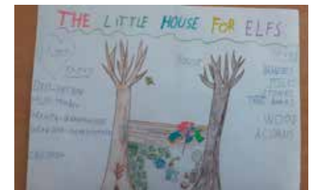
Lesní skřítkci, 3. C

Ráno jsme se sešli ve třídě a rozdělili se do skupin. Obdrželi jsme pracovní listy týkající se píseckých památek. Skupina, ve které jsem byla já, měla Kamenný most. Měli jsme za úkol si připravit menší prezentaci o této památce a tři otázky. Po odprezentování všech šesti skupin jsme odpovídali na otázky, které si pro nás každá skupinka připravila. Za každou správnou odpověď byl 1 bod. Celkem jsme získali sedm bodů. Po velké přestávce jsme se oblékli a vyrazili do města. Nejdříve jsme šli na malé náměstí. Dostali jsme pět minut na to, abychom se porozhlédli po domovních znameních, která se zapisovala do dalších pracovních listů. Pokračovali jsme na velké náměstí a poslední zastávkou bylo Alšovo náměstí. Tam jsme strávili 20 minut. Poté jsme odešli do školy. Celkem naše skupina získala 22 bodů.