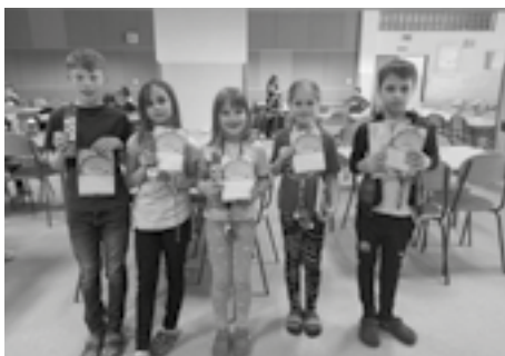
2. — 3. třídy podium