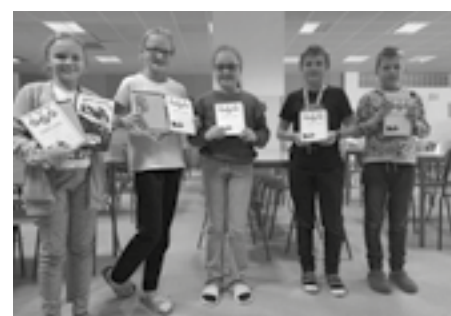
4. — 5. třídy podium