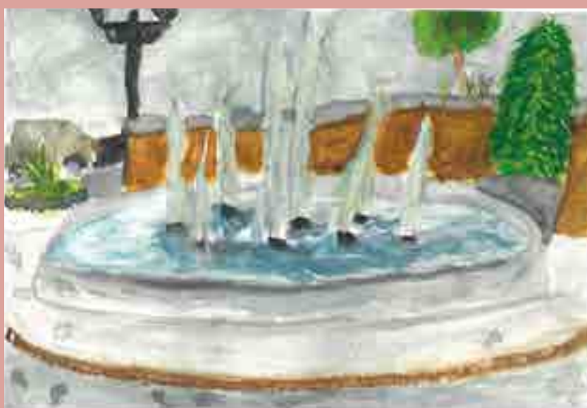
Nikola Lopatová 6. C