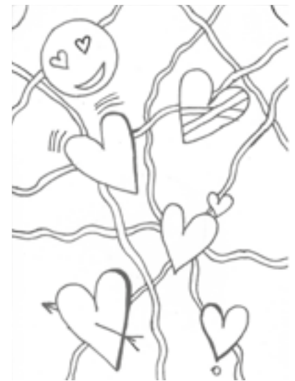
Vojtěch Šafařík 7. C

Emoce prožíváme každý den a jsou nedílnou součástí našeho života a mají velký vliv na to, jak se chováme ke svému okolí. Z toho důvodu je důležité naučit se s nimi pracovat a porozumět jim. Je také důležité porozumět pocitům jiných lidí, protože každý z nás má emoce jinak nastavené a na každého platí jiný přístup.