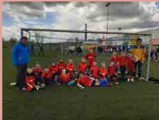
Fotbalový Mc Donald's cup