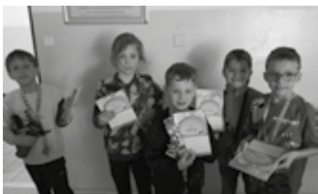
1. třídy podium

Ve čtvrtek 4. 5. 2023 se odpoledne ve školní jídelně konal po několikaleté pauze tradiční turnaj v piškvorkách pro celý 1. stupeň. Z každé třídy mohli být nominováni maximálně tři nejlepší hráči a ti se poté vzájemně utkali každý s každým ve své kategorii. Celkem se turnaje účastnilo 47 žáků, kteří byli rozděleni do 3 kategorií. Prvnáčci (11 dětí), druháci spolu s třetáky (15 účastníků) a čtvrtáci s pátáky (21 žáků). Při tomto počtu bylo potřeba odehrát celkem 370 her, při kterých bylo nutné zachovat velké soustředění. Celé zápolení trvalo téměř dvě hodiny, některým dětem se určitě o křížcích a kolečkách muselo zdát ještě v noci 😊.