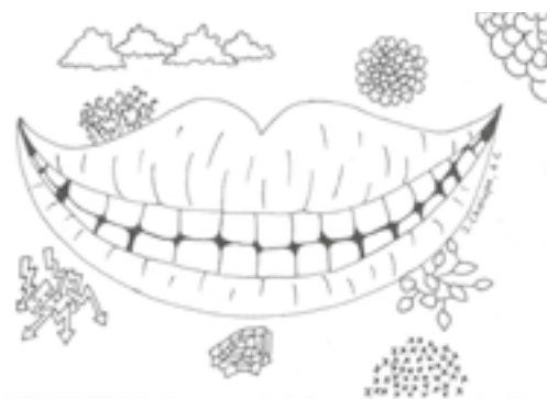
Jáchym Chalupa 6. C