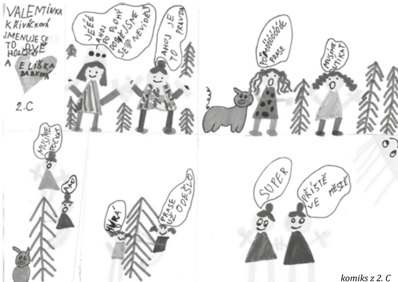
komiks z 2. C