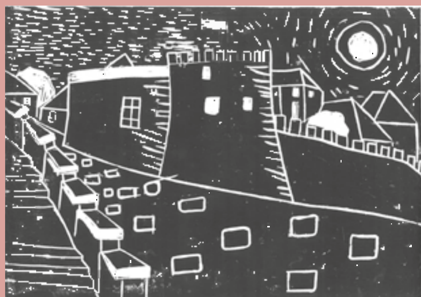
Matylda Němečková 5. C