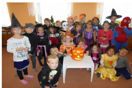
kolektiv 5. MŠ

Zveme vás nakouknout do střípků těchto akcí.