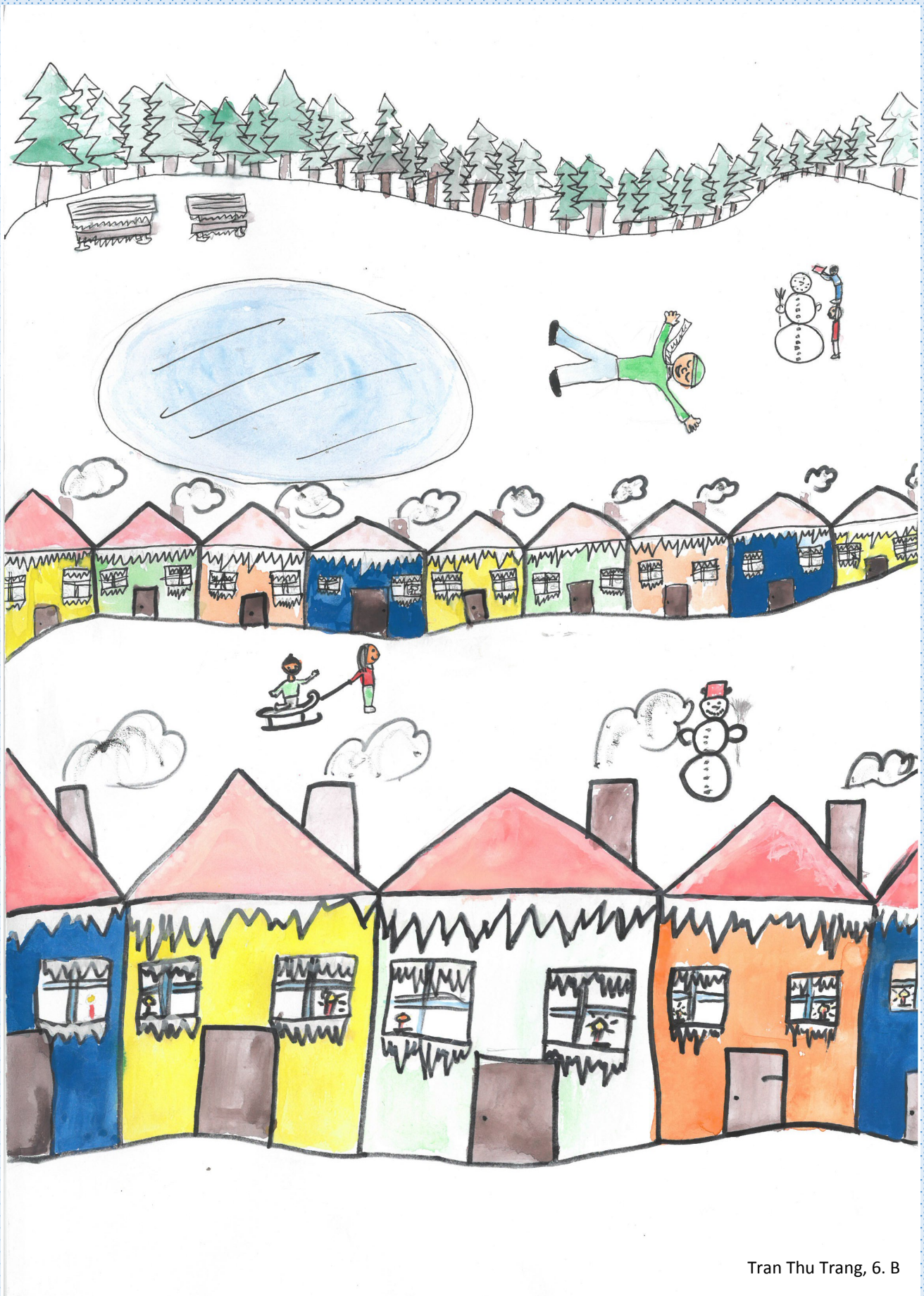
Tran Thu Trang, 6. B